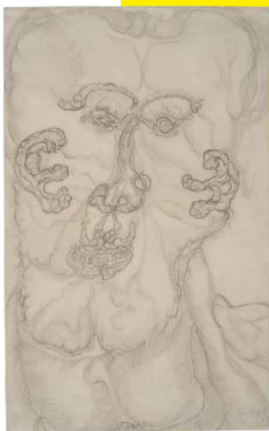
FRIEDRICH STUSS, Luftzeichnung/Air Drawing ca. 1909, Inv. 235.

Die ausgestellten Arbeiten vermitteln einen Eindruck von den Persönlichkeiten hinter den Schöpfungen. Über sie ist eine Form der Annäherung an Opfer nationalsozialistischer Verbrechen möglich, die Zahlen, Fotos oder dürre Fakten nicht erlauben. Die Ausstellung versteht sich insofern als einen Beitrag zur Erinnerungskultur.