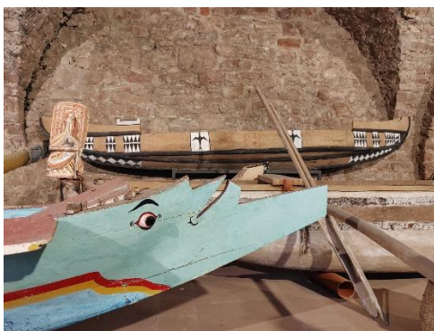
Bootshalle des Völkerkundemuseums