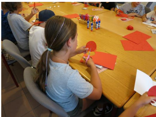
Kreativangebot © Stiftung Reichspräsident-Friedrich-Ebert-Gedenkstätte

11 bis 18 Uhr, ermäßigter Eintritt für alle (5,00 €) 11 und 13 Uhr, kostenlose Führungen durch die Sonderausstellung „101 Jahre ‚Neue Typographie‘ 1923–2024. Die Bauhauschrift im Marken- und Verpackungsdesign“ Anmeldung erforderlich per E-Mail an museum@verpackungsmuseum.de www.verpackungsmuseum.de