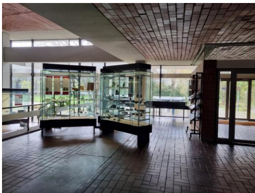
Museum Institut für Geowissenschaften

16 bis 18 Uhr, „Fälschen wie gedruckt“, offene Druckwerkstatt für alle in der MALSTUBE des Museums, ohne Anmeldung, Teilnahme frei www.museum.heidelberg.de