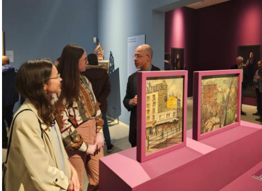
Ausstellung Kunst und Fälschung

11 Uhr, Familienführung mit der Handpuppe Nelke Nelly und anschließendem Kreativangebot: Basteln einer Anstecknelke und Ausmalbilder, ohne Anmeldung, kostenfrei www.ebert-gedenkstaette.de